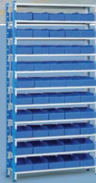
Envie de couleurs : une large palette de coloris RAL à disposition (+5%).