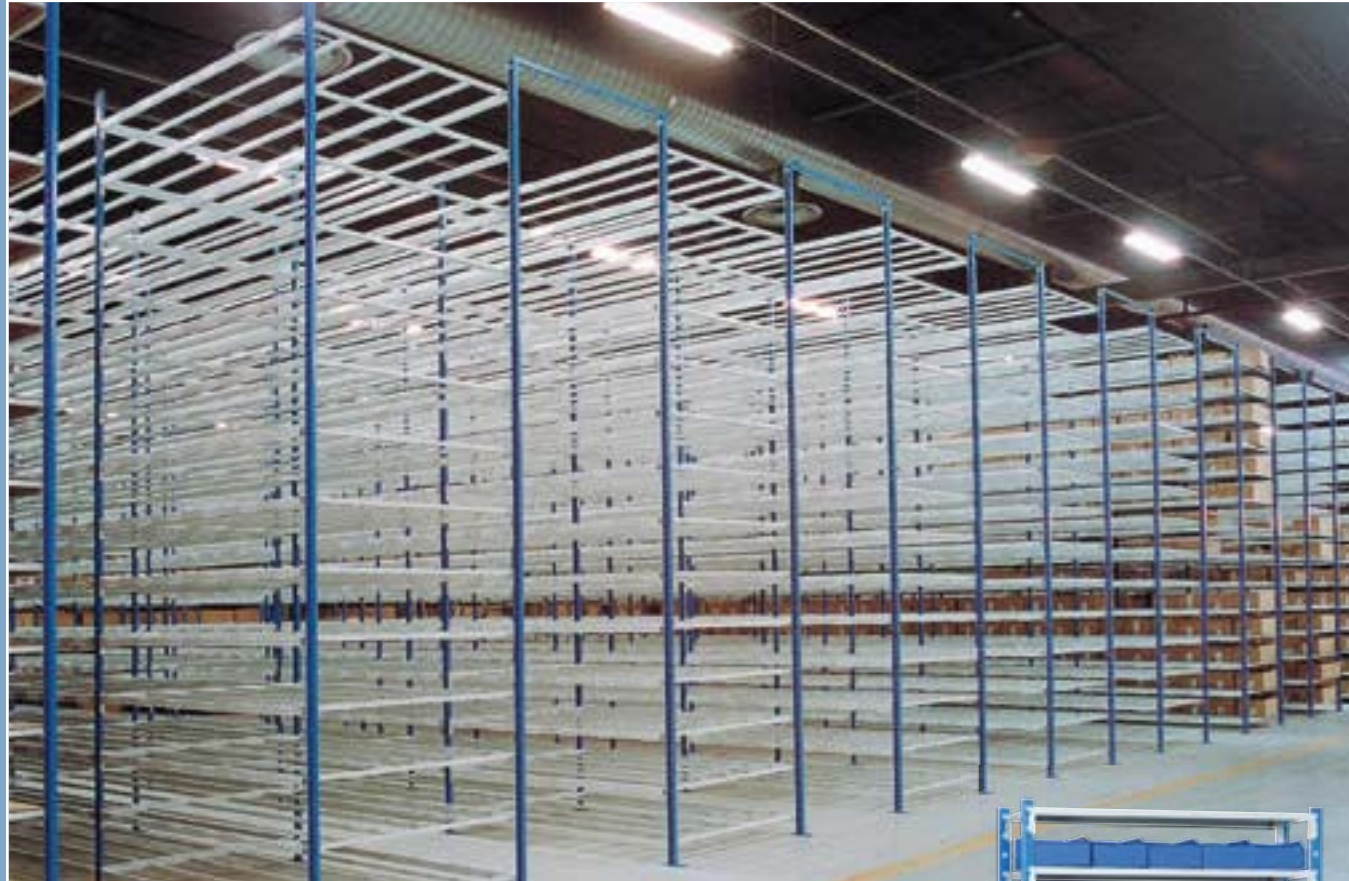
D'une simple travée aux installations les plus conséquentes ... des capacités techniques et des solutions pour satisfaire vos exigences !