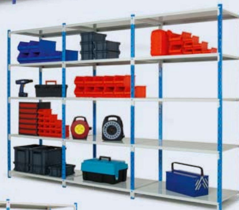
Rayonnage Fliclass avec tablettes tôlées.