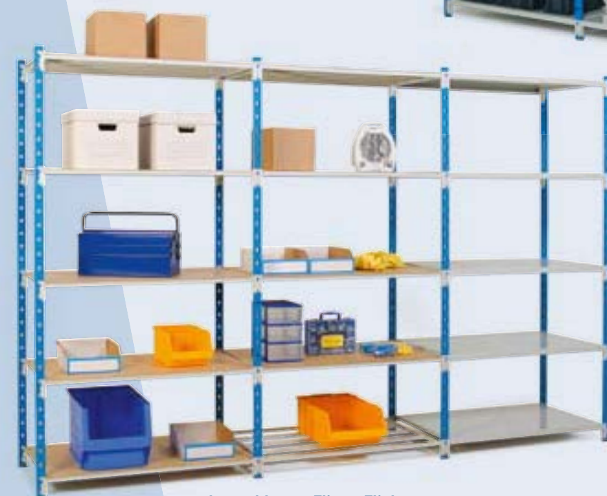
Les tablettes Flip et Fliclass sont entièrement compatibles entre-elles.