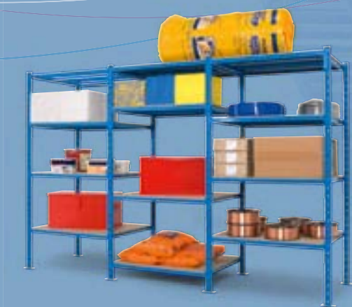
A chaque besoin de stockage, sa solution !