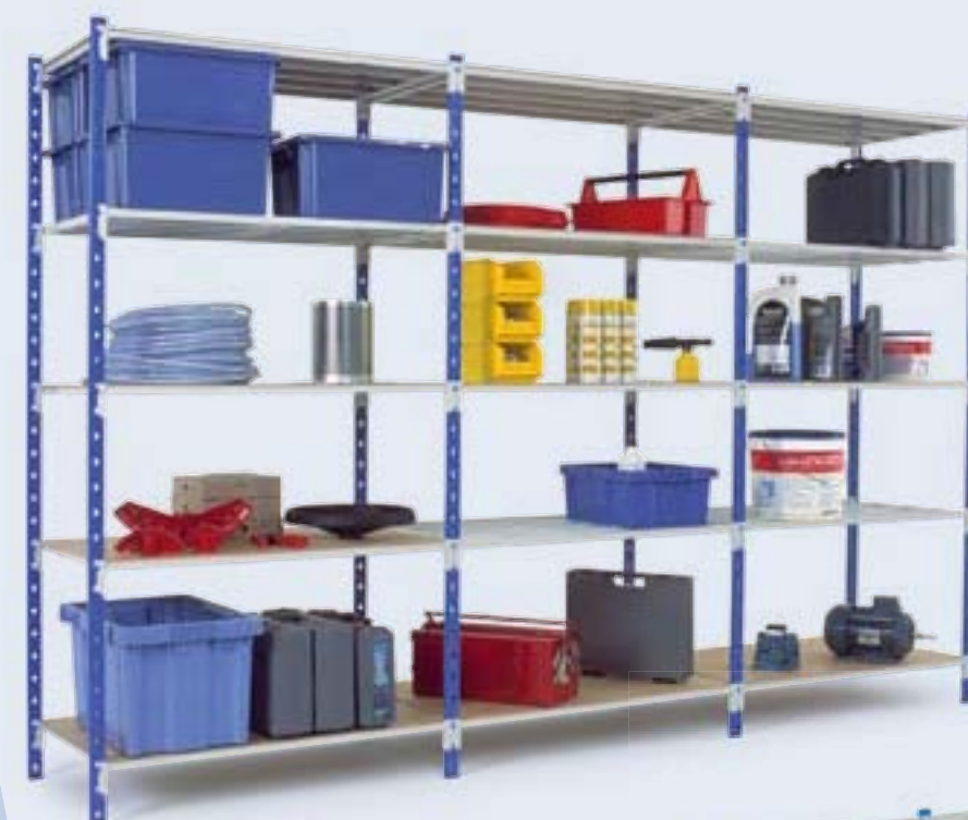
Rayonnage Flip avec tablettes tubulaires et dessus isobois.