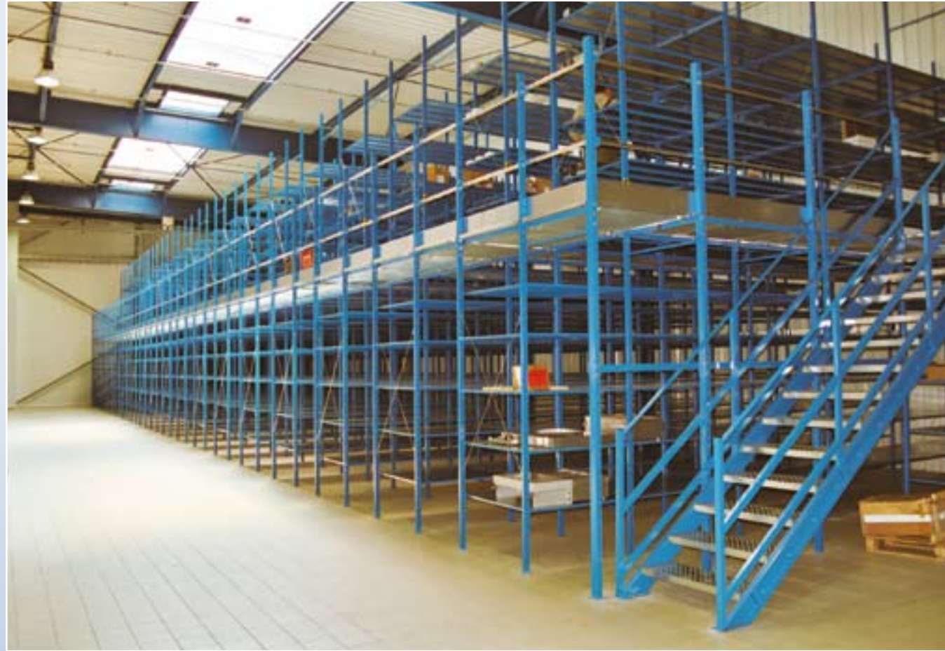
Le rayonnage FLIPLUS permet la réalisation d'installations sur plusieurs niveaux